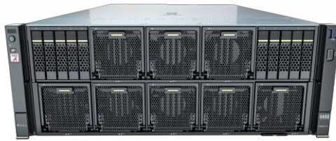
KunLun G5680 V2

KunLun G5680 V2 是一款4U4路AI服务器，是基于鲲鹏920与昇腾910芯片的AI推理服务器，具有超强算力密度、超高能效与高速网络带宽等特点。该服务器广泛应用于深度学习模型开发和训练推理，适用于智慧城市、智慧金融、教育科研、运营商等需要大算力的行业领域。