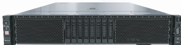
( KunLun 2180 V2 )

该服务器面向互联网、分布式存储、云计算、大数据、企业业务等领域，具有高性能、高安全、高可靠、高效能等优点。